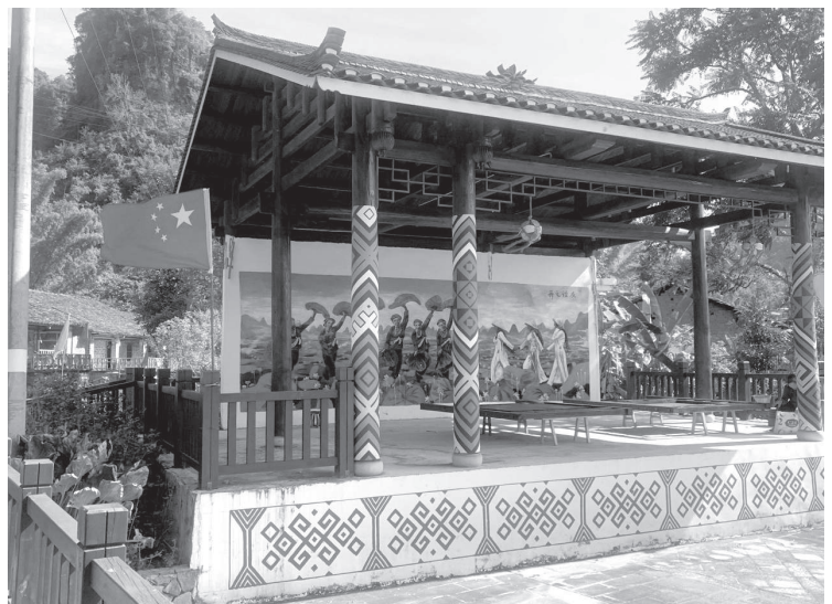
(写真2 大村の壁画：民族文化と国民国家の交差 2023年12月21日)