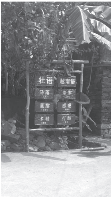
(写真1 観光客向けにベトナム語を指南する標識 2021年8月20日)

この多文化的な要素が混在する視覚的シンボルは、大村が単にチワン族が何世代にもわたって生活する土地というのではなく、国境地帯という特殊な位置にあり、同時に中国の領土であることを示している。それによって、ベトナム人チワン族結婚移民女性と中国人チワン族が共同生活を営むこの地において、観光業という経済活動が、ベトナム人チワン族結婚移民女性たちに「チワン族」という民族アイデンティティを超えた「ベトナム人」としての国民国家帰属を強調させている。